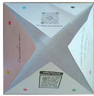
3. photos contre la table robots les 4 coins vers le milieu du carré