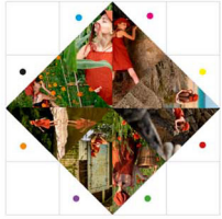
1. Découpe le contour du carré