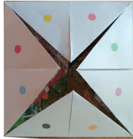
5. Rabats de nouveau les 4 coins vers le milieu