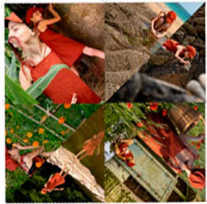
4. Retourne le pliage