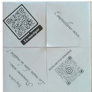
7. Retourne le pliage, plie le carré en 2 puis place tes doigts dans les cachettes